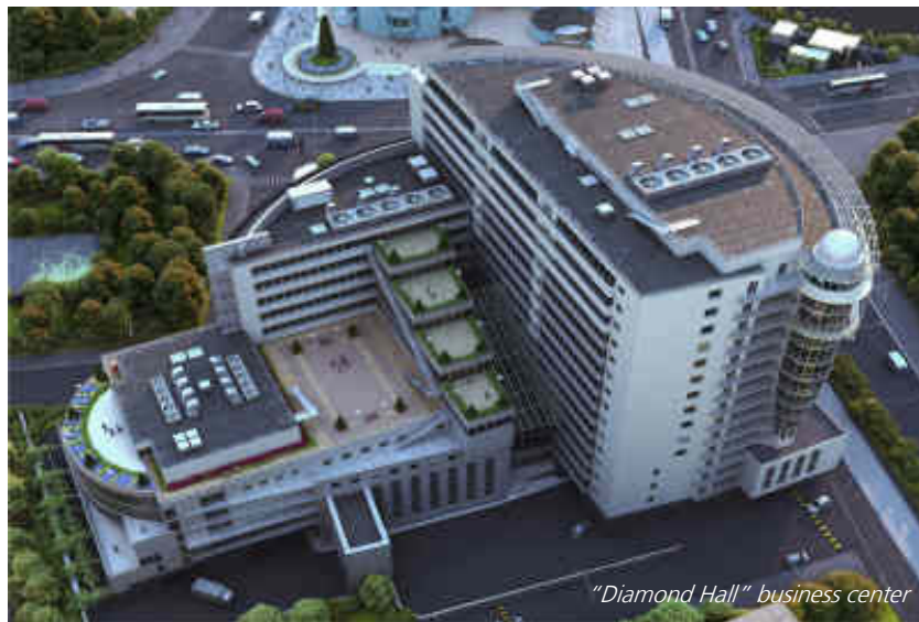
"Diamond Hall" business center

I prezzi di vendita degli uffici a Mosca variano moltissimo: per esempio una casa