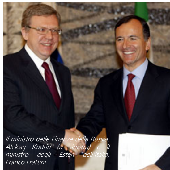
Il ministro delle Finanze della Russia, Aleksej Kudrin (a sinistra) e il ministro degli Esteri dell'Italia, Franco Frattini

I due Paesi intendono sviluppare una serie di progetti congiunti nel settore aerospaziale, nella medicina avanzata e nelle biotecnologie.