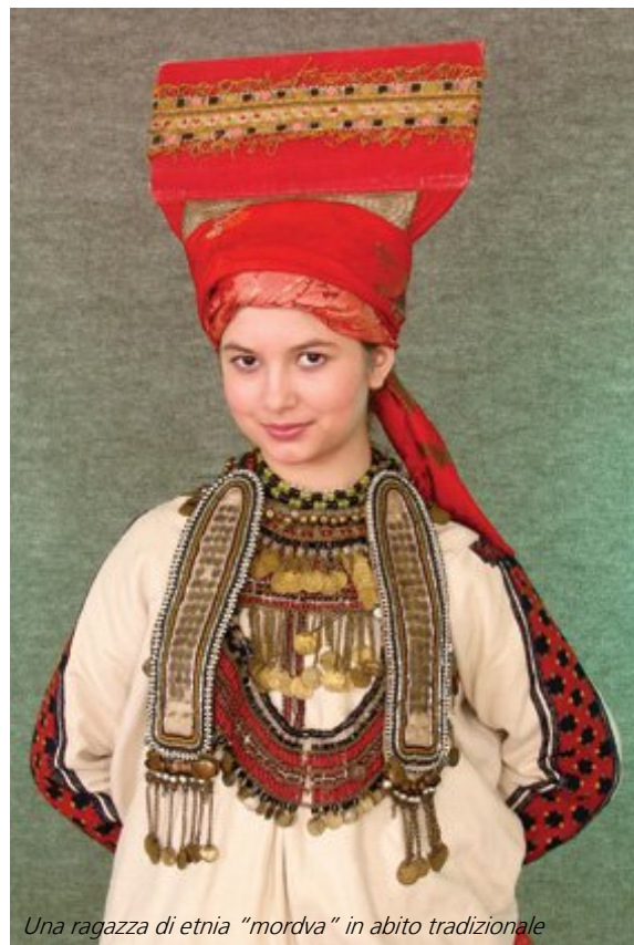
Una ragazza di etnia "mordva" in abito tradizionale

In quanto a produzione di carne, di latte e