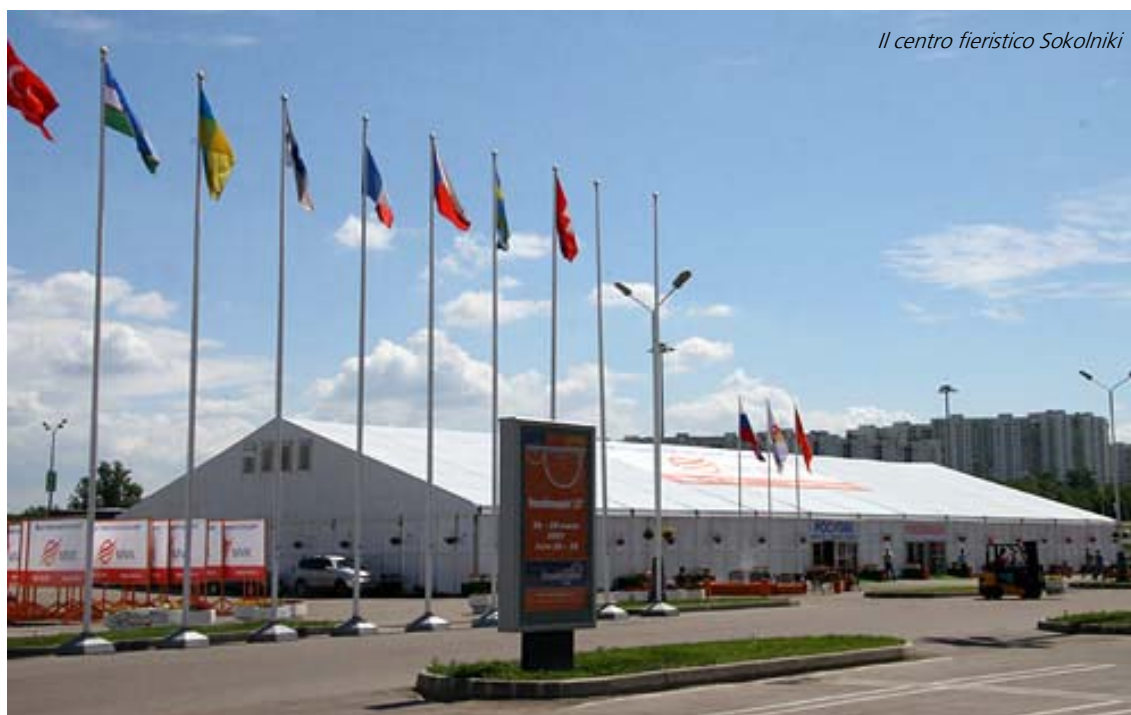
Il centro fieristico Sokolniki