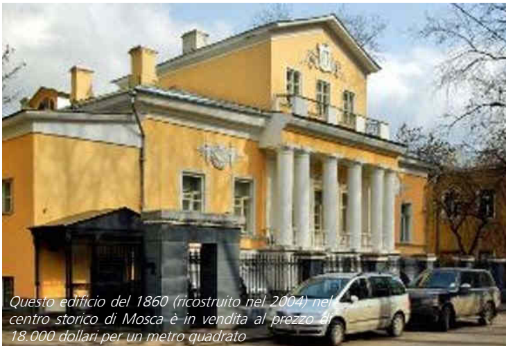
Questo edificio del 1860 (ricostruito nel 2004) nel centro storico di Mosca è in vendita al prezzo di 18.000 dollari per un metro quadrato

di mille metri quadrati in via Chistij Pereulok viene offerta a 18mila dollari al metro quadrato (vedi la foto), mentre in via Stanislavskij un metro quadrato nel centro di uffici della classe B costa 7.650 dollari. Fuori dal centro i prezzi variano da 6.000 a 7.500 dollari al metro quadrato. Con la ripresa economica e con il ripristino della domanda ci si aspetta che i prezzi raggiungano alla fine del 2010 - inizio del 2011 i livelli precedenti alla crisi. Molto indicativo dovrebbe essere il primo trimestre del 2011, periodo in cui sarà chiaro in che direzione si svilupperà il mercato degli immobili per uffici di