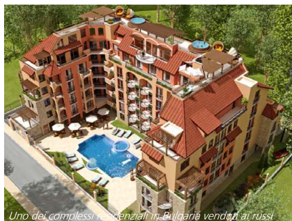
Uno dei complessi residenziali in Bulgaria venduti ai russi

L'Italia si classifica al sesto posto con il 5,8% dei potenziali investitori russi. Seguono la Repubblica Ceca (4,9%), la